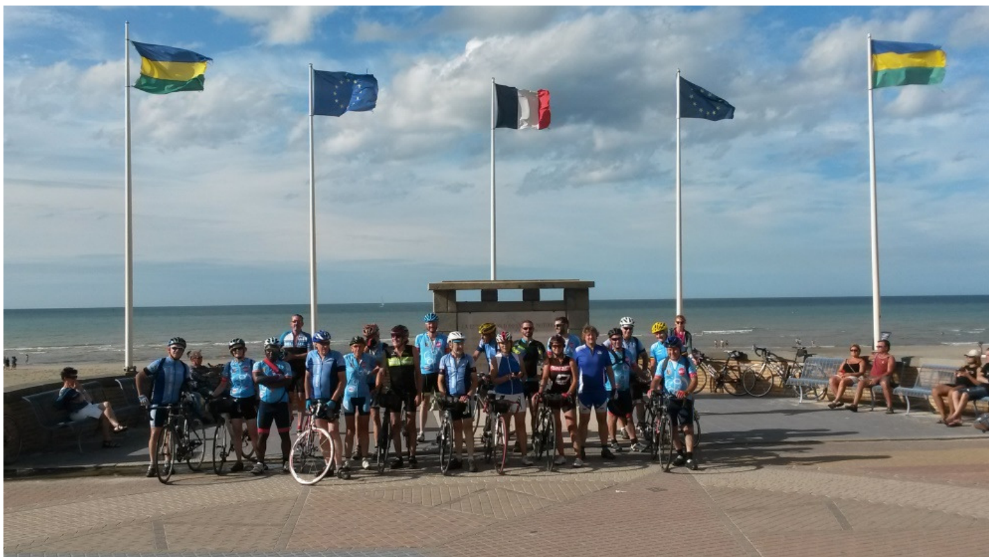
Novembre Souper Club