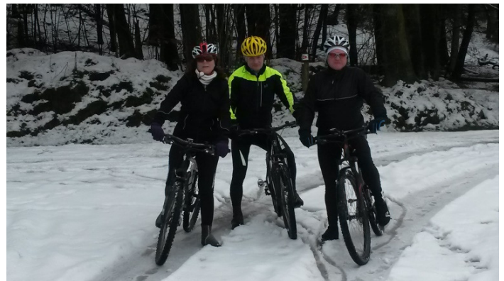
Condé : Picon et grand feu pour un trèfle...raccourci