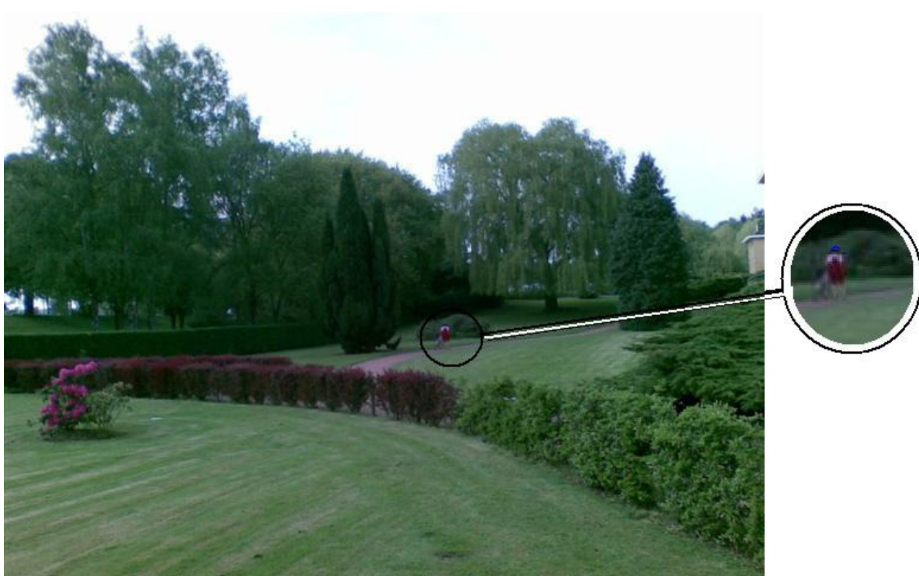
Cyclo errant dans le jardin des Ursulines.

A l'heure du bilan du MCM 2009, le conseil d'administration se doit de déplorer un point noir dans l'organisation: le fléchage insuffisant à l'intérieur des Ursulines.