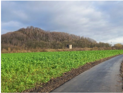
Terril de l'Héribus (Cuesmes [Mons]) et extension du Ravel 98c qui a vu sa fréquentation exploser depuis l'année dernière.

Pour ce faire, les terrains de jeu sont nombreux en Wallonie et nous n'en sommes peut-être pas assez fiers. Il faut dire aussi que nous avons l'art de les saccager (dépôts sauvages, cyclo qui jette ses déchets par terre...)