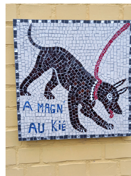
Marche Adepts Chêne aux Haies, Mons, 28/11/2021.