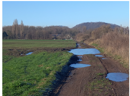
Au loin le terril du Levant (Flénu [Mons]) Un chemin agricole idéal pour la course à pied et dorénavant pour le gravel.

Dans un contexte général bien flippant, j'ai vraiment profité de mes différentes sorties quel que soit le sport pratiqué. On ne remerciera jamais assez tou.te.s les bénévoles (sur le terrain et dans les fédérations) qui nous permettent de réaliser ces chouettes balades. Si tout se met bien, mon premier BàD sera au plus tard le Bois de la Houppes à Warchin le 16 avril. C'est un de mes parcours préféré !