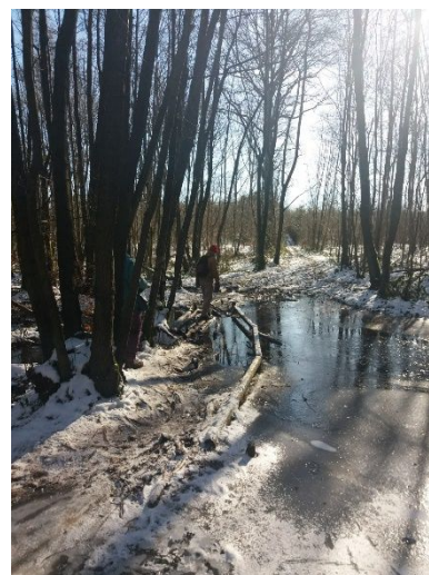
Dans la neige, Bois Brûlé à Ghlin, 14/02/2021.

Refaire à pied des parcours déjà effectués en vélo.