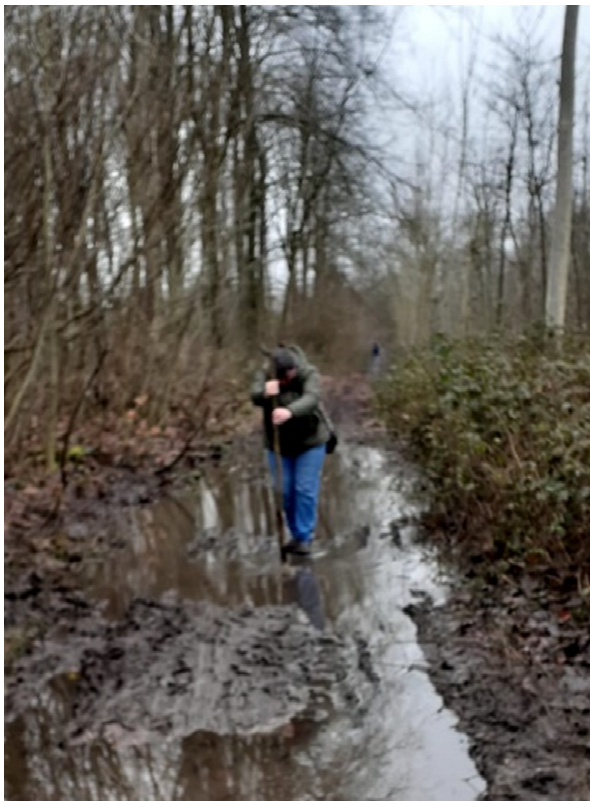
Moïse essayant d'écarteler les eaux. Mont Panisel, Hyon (Mons) 31/01/2021