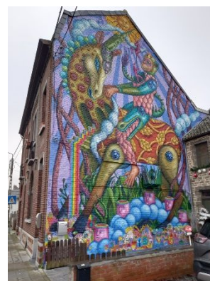
Magnifique fresque murale, Hyon (Mons) Elle se trouve sur un de mes trajets « utilitaires »

Points + : très beau parcours avec des passages totalement inconnus pour moi. La seule fois où j'ai mis tout à gauche cette saison.