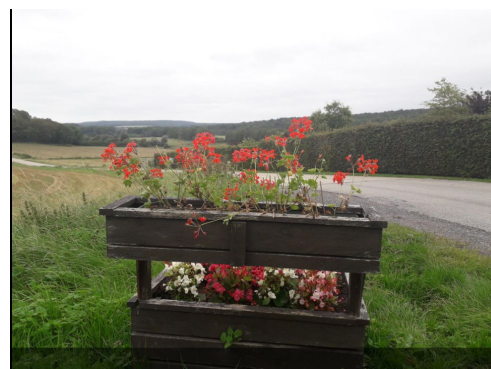
Magnifique vallée du Viroin (BâD au départ de Florennes, 80km, 01/09/2021. Club : Cyclo Audax Sambrien)

Je parle bien ici de trail et non pas d'ultra trail 1 .