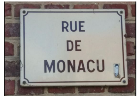
Je ne connaissais pas cette Principauté. Photo prise lors d'une rando à pied du côté d'Éclusier-Vaux (Somme)