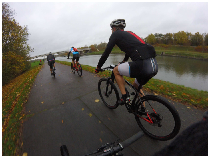
Récupération sur le halage