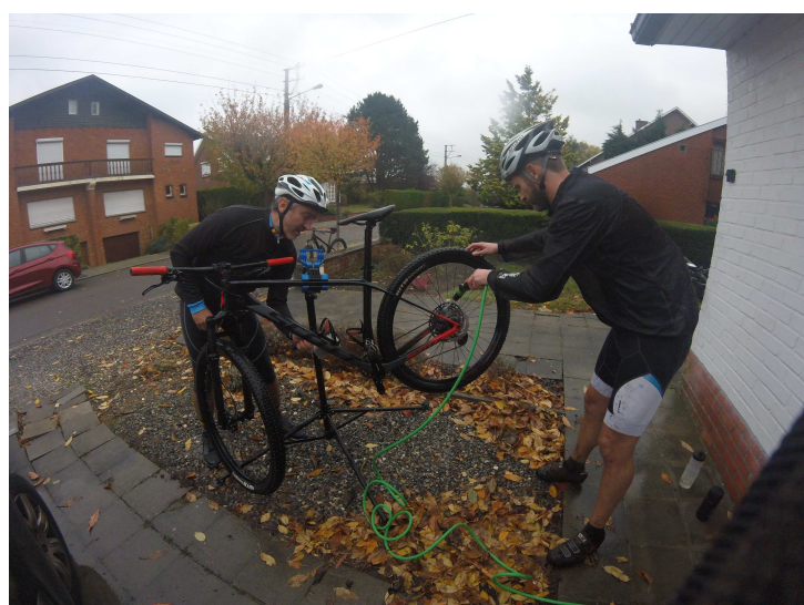
Nettoyage en équipe