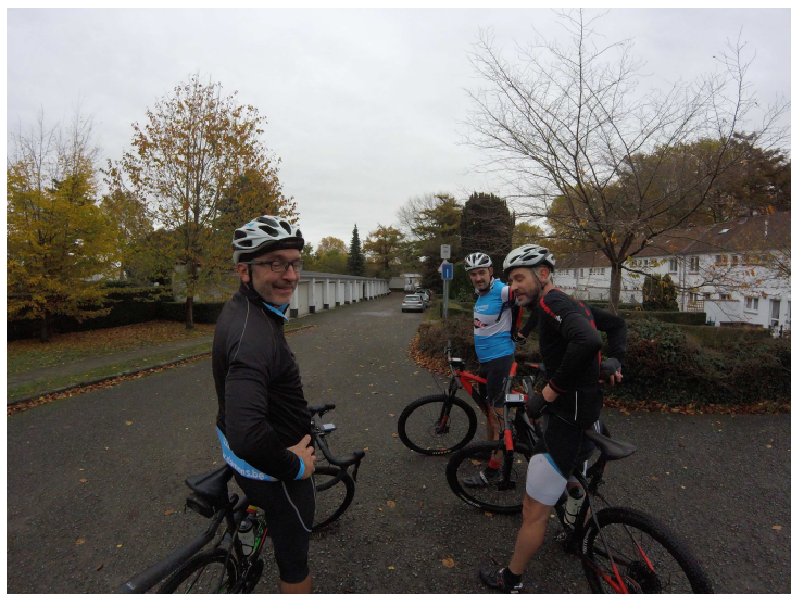
C'est parti pour 3 heures d'amusement