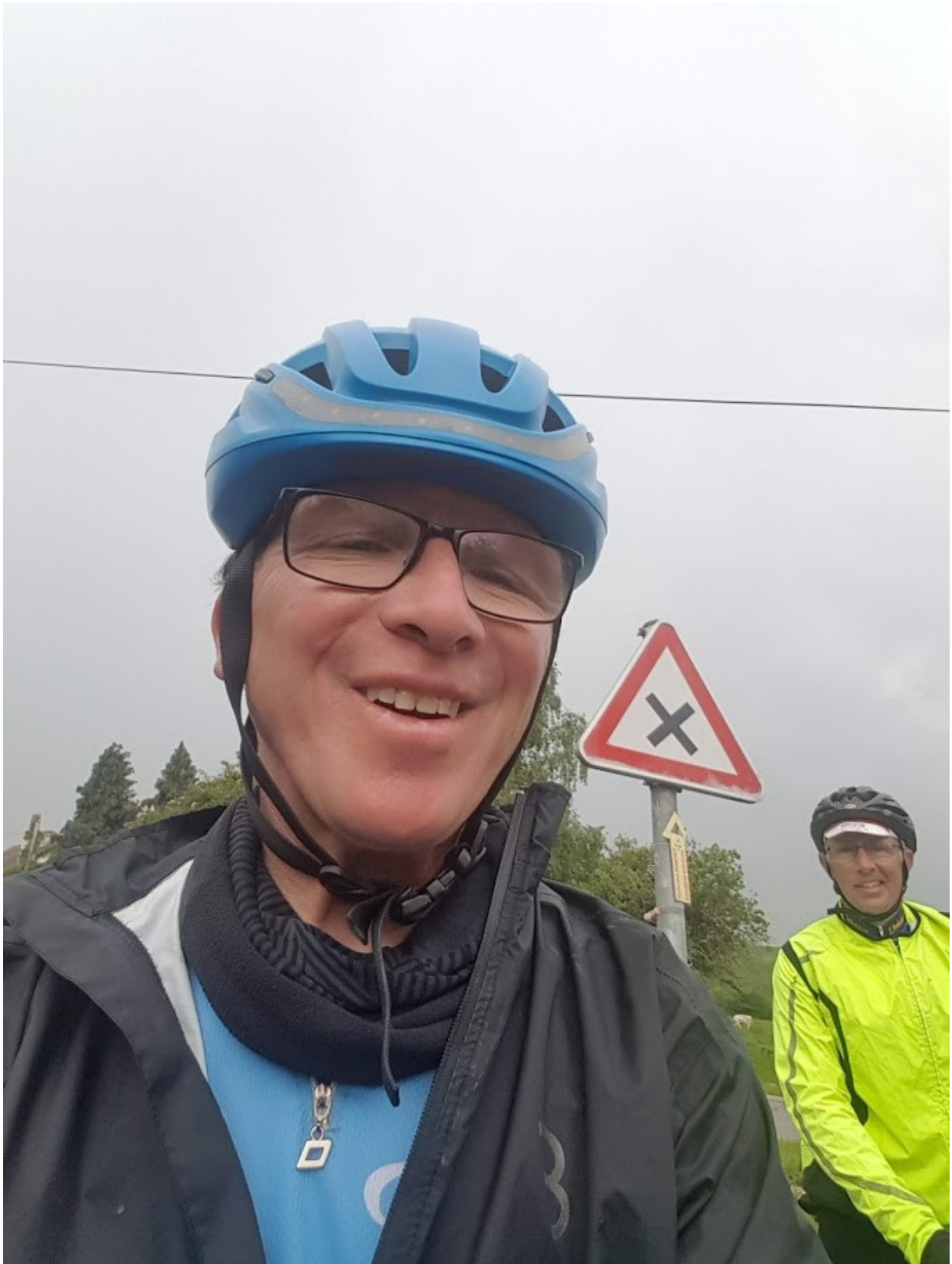
Restant de fléchage du Cyclo Club Bomerée à Fraire