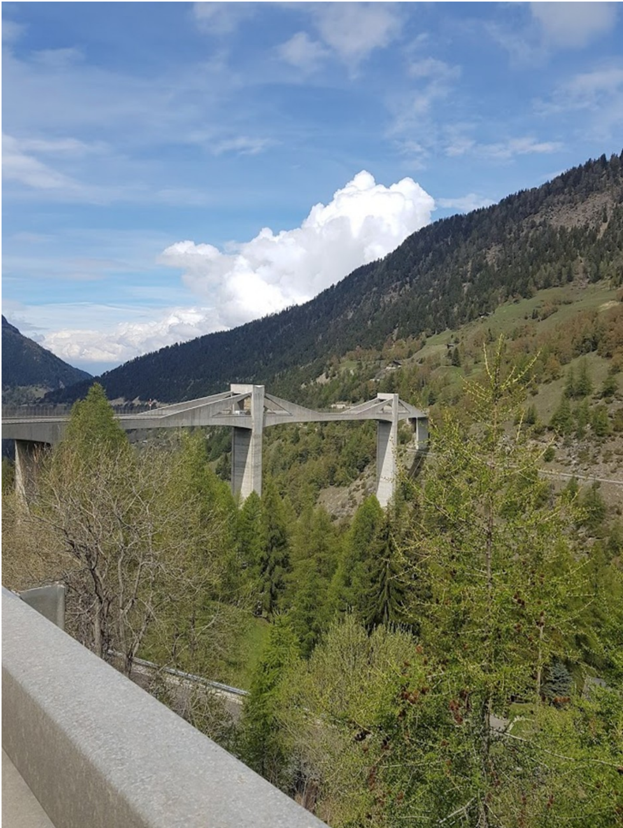
Un des nombreux viaducs de la descente du Simplon

Nous prenons ensuite la piste cyclable de la vallée du Rhône qui longe le fleuve tumultueux. Nous nous arrêtons pour le repas de midi à Getwing dans un restaurant pas très chaleureux. Nous passons