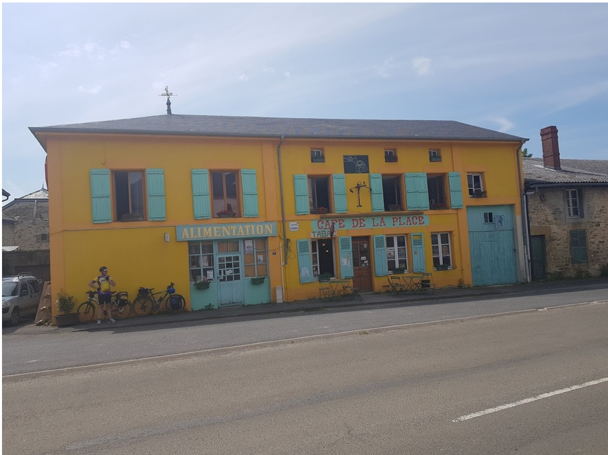
Le café de la place à Briulles sur Bar.

Nous rentrons alors dans le département des Ardennes à Apremont, et il faut bien reconnaître que le relief est bien âpre. Il y a vraiment une succession de raidillons avec des villages haut perchés. Nous nous ravitaillons une dernière fois à Briulles-sur-Bar où le café-épicerie vaut vraiment le détour pour ses couleurs chatoyantes et pour son patron haut en couleur aussi. Nous escaladons quelques bosses avant une plongée vers la Meuse, notre fleuve préféré. Nous empruntons la voie verte pour rejoindre Charleville où nous mangerons un bon repas pizza sur la place ducale. Ce sera le seul repas pris en terrasse lors de ce voyage où nous en avons vu de toutes les couleurs.