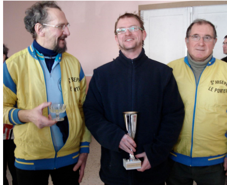
Une coupe pour récompenser... « Le Belge »

L'accueil est vraiment sympathique et les membres du club local m'informent de leurs diverses organisations dont la principale se déroule le premier dimanche de mai.