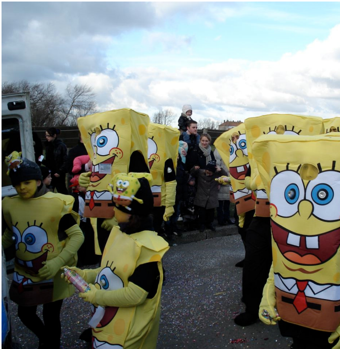
(carnaval de Le Portel)

Quelques jours plus tard : catastrophe ! Depuis plusieurs semaines, j'ai mal au dos. Le diagnostic est sans appel : lombalgie et autres joyeusetés. Cela ne m'empêche pas de rouler en vélo mais les trajets en bagnoles me sont insupportables. Aywaille, Aïe ! Aïe ! Aïe !