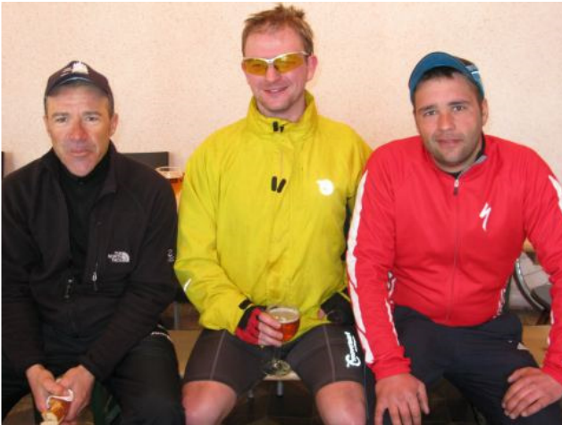
En plein « désœ�iffage » à l'arrivée de mon premier BRB, fourbus mais contents.

Après une année 2009 somme toute correcte et mon premier BRB dans des conditions apocalyptiques, mon objectif 2010 est le Liège-Bastogne-Liège cyclo. Je l'ai raté en 2009 en raison d'une blessure au pied. Récit de cette année 2010 avec des reportages « à chaud » de mes diverses sorties.