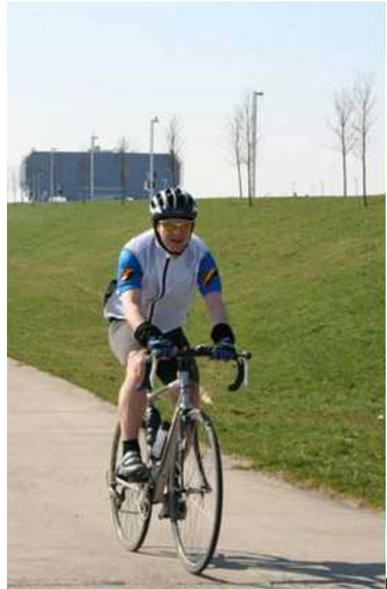
Les Cotacols du centre, un classique en 2009.

La pleine forme se confirme. Après le BâD des Cyclo Sigma-Fina, je décide de faire une infidélité aux cyclos manageois pour refaire le BRB de Péruwelz : 200 km de pur bonheur, en grande partie dans le magnifique Pays des Collines. Je le gère beaucoup mieux que l'an passé. Cela sera d'ailleurs une constance cette année, je roule un (tout) petit peu plus vite et de manière plus intelligente, surtout sur les « grandes » distances.