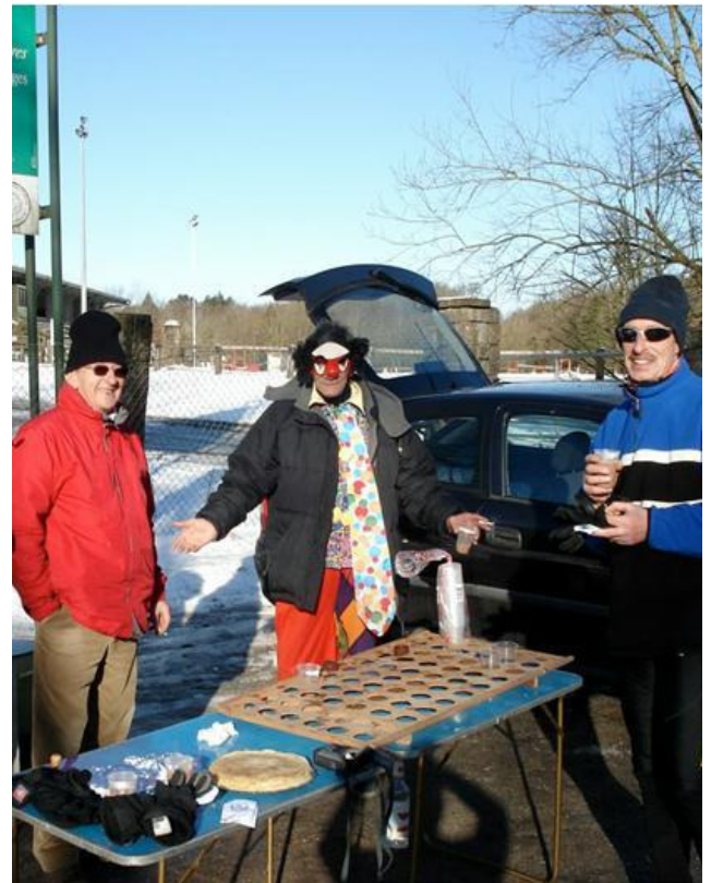
Ravito avec crêpe, chocolat chaud amélioré et...un clown !

Il était dès lors impossible de rater le carnaval après-midi.