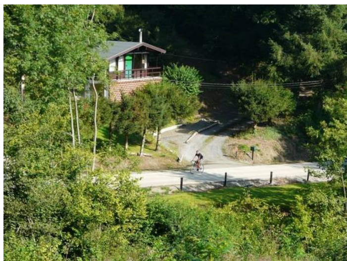
De magnifiques paysages...

Par après, j'effectuerai un second cyclo-côteur (18ème flèche carolorégienne) organisé par le cyclo-club Bomerée. J'irai jusqu'au bout malgré un gros coup de mou (et des envies d'abandon) au troisième ravito. Parti trop vite, j'ai mal géré mes efforts. Une monumentale erreur de débutant, l'arrivée en a été d'autant plus joyeuse !