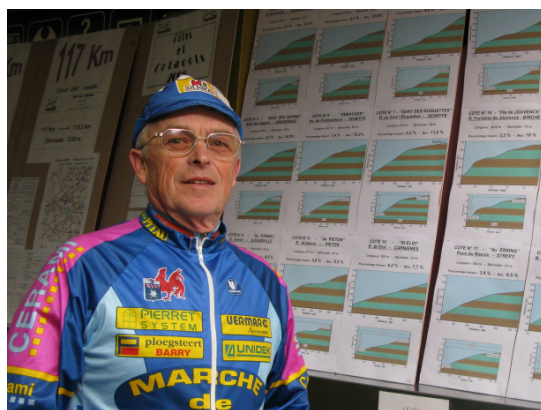
En arrière-plan, les différents cotacols qui attendent les « grimpeurs » du Centre