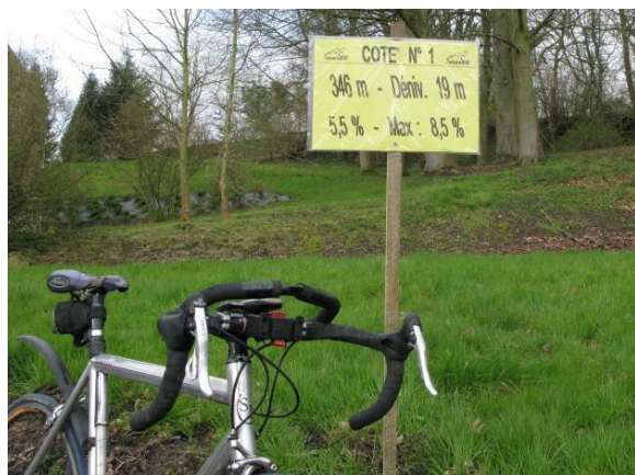
Les fameux panneaux des Cotacols du Centre .

Les conditions atmosphériques ne sont pas très avenantes (pluie glacée, vent et grêle !) Cela n'entame pas mon enthousiasme et je suis particulièrement séduit par les Cotacols du centre. Nos amis de Manage ont fait les choses dans les règles de l'art. La route n'est pas toujours bien entretenue mais le tracé est superbe. À chaque « cotacol », un panneau indique la longueur de la côte, son dénivelé moyen et son pourcentage maximum. Je retrouverai à plusieurs reprises des membres du cyclo-club au cours de la saison.